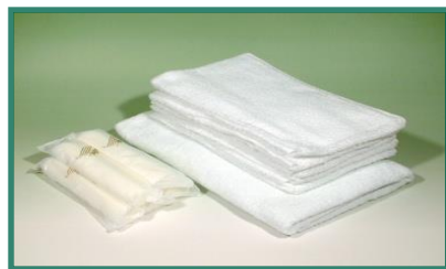
（※写真はイメージです。）